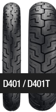
D401 / D401T